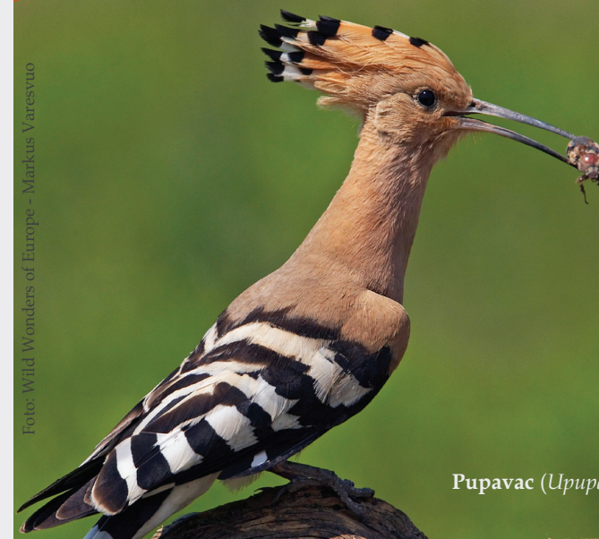
Pupavac ( Upupa epops )