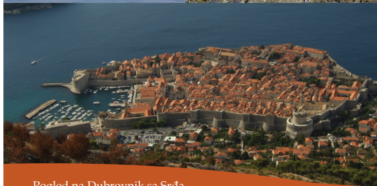
Pogled na Dubrovnik sa Srđa